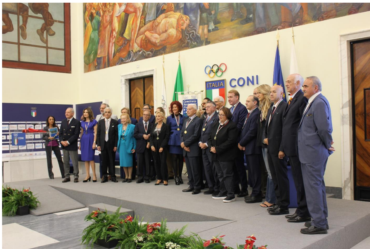
TUTTI I PREMIATI IN POSA

Nel Salone d’Onore del CONI – il 25 ottobre 2019